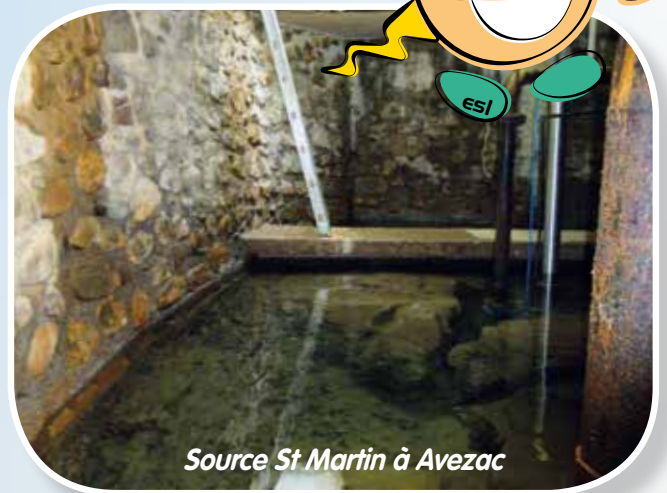
Source St Martin à Avezac