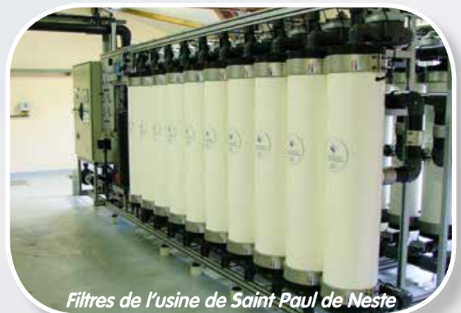
Filtres de l'usine de Saint Paul de Neste

L'eau est ensuite chlorée puis élevée au réservoir à partir duquel elle est distribuée avec celle d'Avezac, par gravité naturelle, aux collectivités de Lannemezan et alentours.